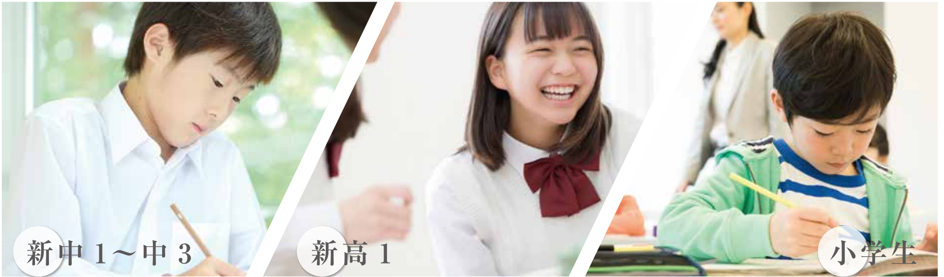
新中 1～中 3